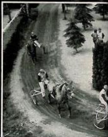
... ještě několik ukazkových koleček pro diváky a sázkaře, ve vzduchu visí atrazník. Vsadit kolik a na koho?