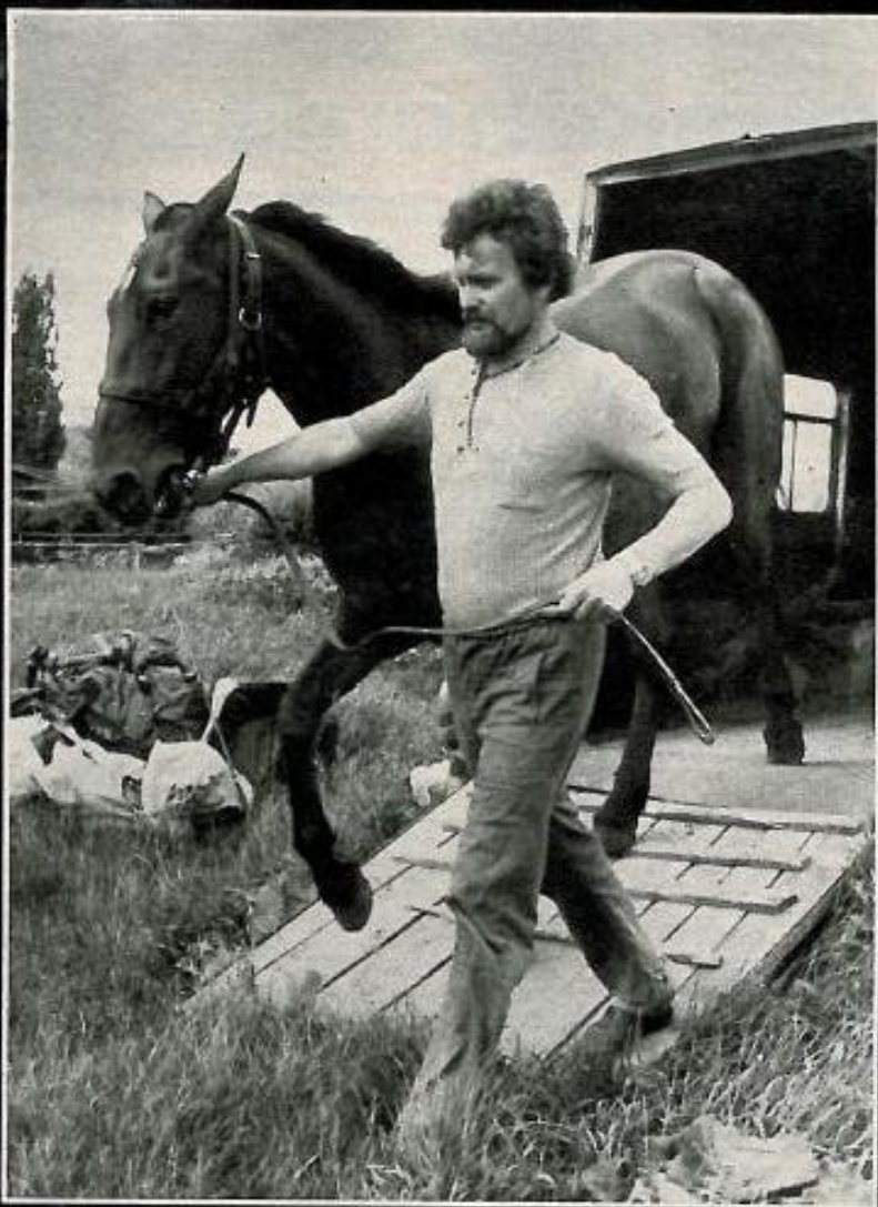
Tak toto hobby je skutečný koníček. Jmenuje se Zlatý kluk, což se v maďarštině říká Aranyfju, má hodnotu tři set tisíc korun minimálně a patří ke klusáckým esům. Pochází z MLR a byl odtud zakoupen JZD Dukla Pílarov v roce 1977. Dvakrát vytvořil čs. rekord!