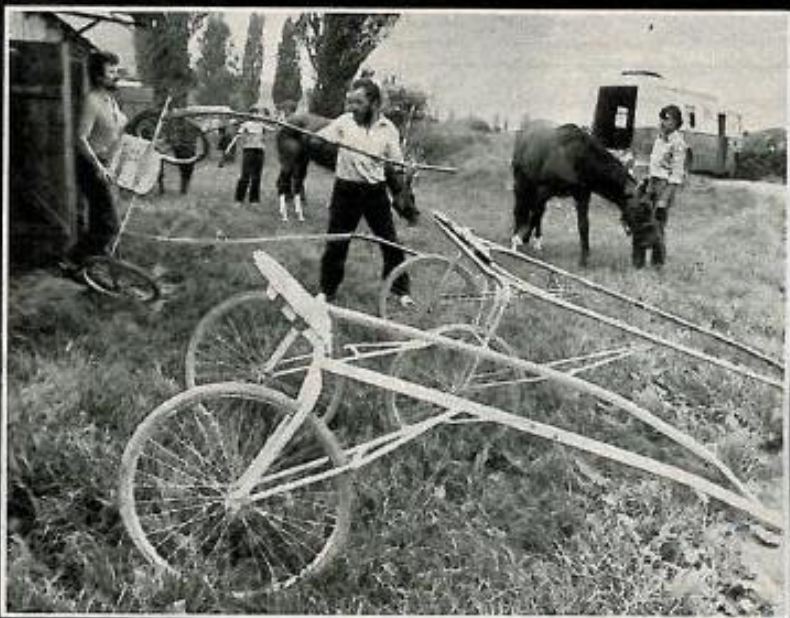
Ta křehká věc je dvojkolka zvaná sulkou před závodem je třeba ji pečlivě zkontrolovat, neboť nehoda není náhoda.